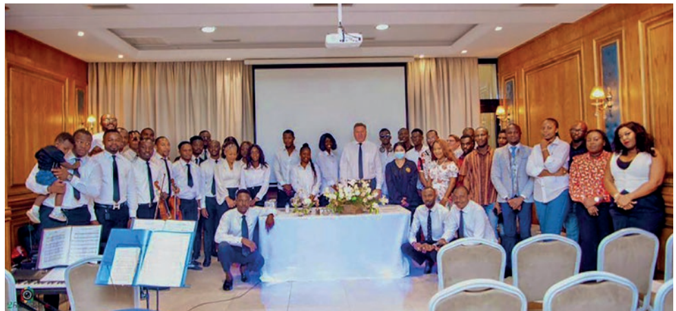
Photo de groupe avec les frères et sœurs et invités

Pour l'occasion, de nombreux amis ainsi que tous les directeurs de département de l'université MIT Polytech ont été invités à participer au service divin par nos jeunes frères et sœurs. De nombreuses personnes de confession musulmane ont également assisté au service divin.