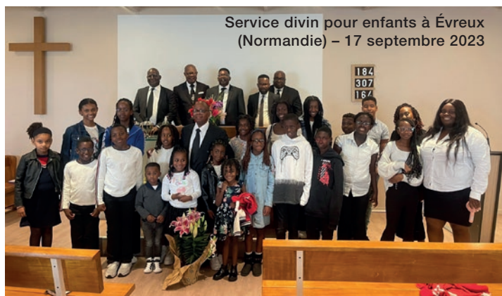
Service divin pour enfants à Évreux (Normandie) – 17 septembre 2023