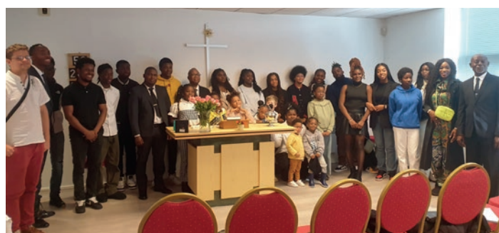
Service divin de jeunesse à Saint-Nazaire (Bretagne) – 29 octobre 2023

En particulier à Évreux, l'ancien de district Kondelo a profité de cette occasion pour présenter la nouvelle équipe dirigeante de la jeunesse du district Normandie-Bretagne.