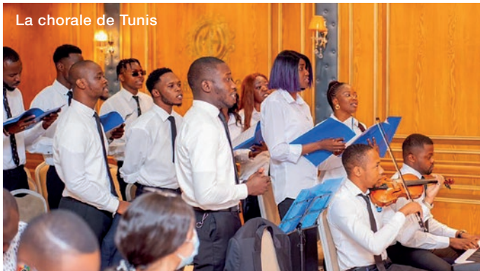
La chorale de Tunis