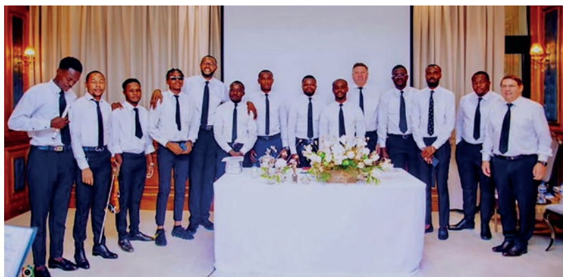
Photo de groupe avec les frères de Tunis

À l'issue de celui-ci, tous les participants ont été invités à partager quelques instants de convivialité autour d'un bon repas.