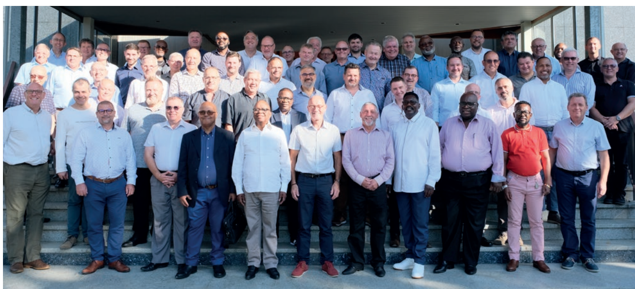
Photo de groupe

Une deuxième partie du séminaire, plus participative, a vu les participants se diviser en sous-groupes pour échanger de vive voix sur « les bonnes pratiques du responsable » :