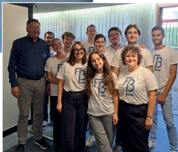
La jeunesse en soutien logistique

il s'agissait pour eux, non pas de dresser un catalogue des difficultés et problèmes rencontrés, mais, au contraire, de partager leurs expériences réussies, en vue de favoriser le dialogue et le rapprochement entre eux. Six thèmes leur étaient proposés, dont, notamment, leur soutien aux ministres et aux personnes investies de responsabilités, la promotion de la collaboration des membres des districts et communautés à la vie de ceux-ci, la délégation ou encore les tâches pastorales particulières.