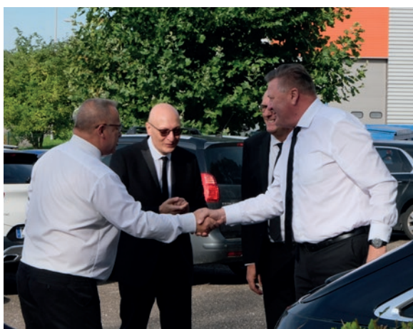
Accueil de l'apôtre de district

À leur grande joie, l'apôtre de district a pris congé individuellement des participants au séminaire. Leur joie se lisait dans l'éclat de leurs yeux.