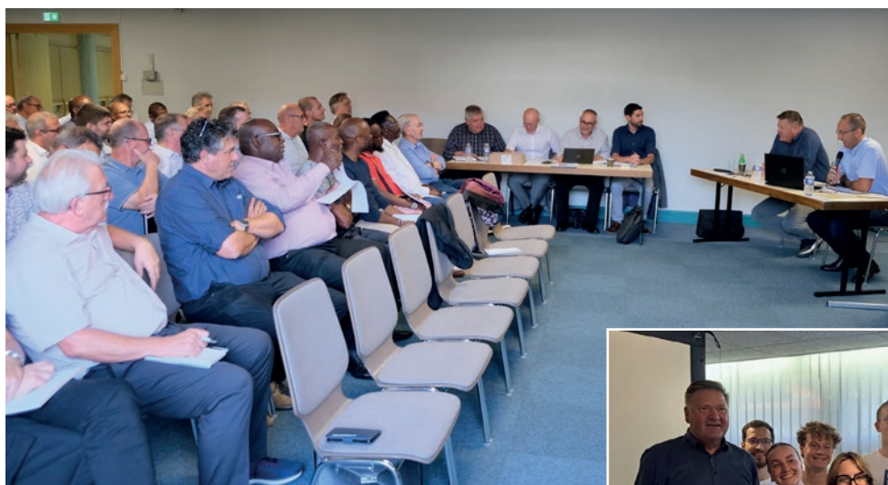
Pendant le séminaire avec l'apôtre de district