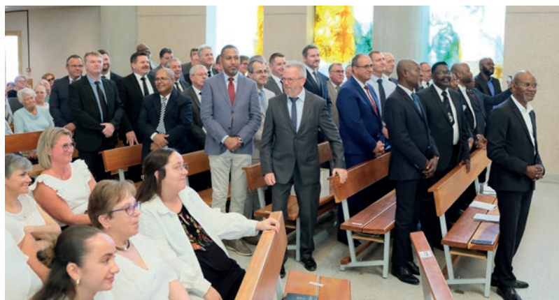
Les conducteurs de communautés de France, de Belgique francophone et du Luxembourg