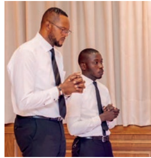
Célébration de la sainte cène pour les défunts