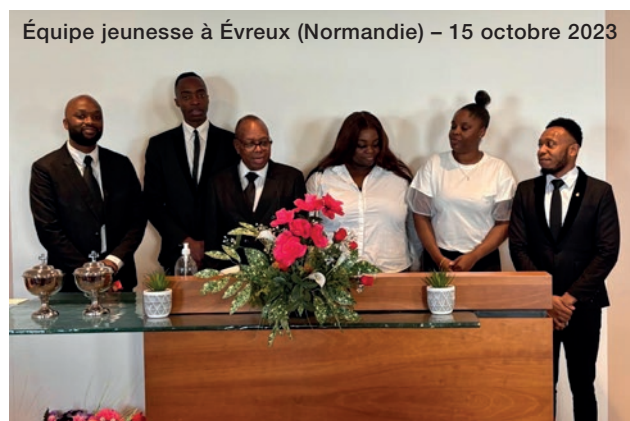
Équipe jeunesse à Évreux (Normandie) – 15 octobre 2023

De septembre à novembre, plusieurs rencontres ont été organisées pour les jeunes et les enfants dans le district Normandie-Bretagne : le 17 septembre, un service divin destiné aux enfants de Normandie, à Évreux ; le 15 octobre, un service divin pour les jeunes de Normandie à Évreux ; le 29 octobre, un service divin pour les jeunes de Bretagne à Saint-Nazaire ; le 12 novembre, un service divin pour les enfants de Bretagne à Rennes.