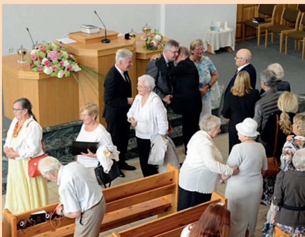
Apaštalas poilsyje su žmona pamaldose Klaipėdos bendruomenėje