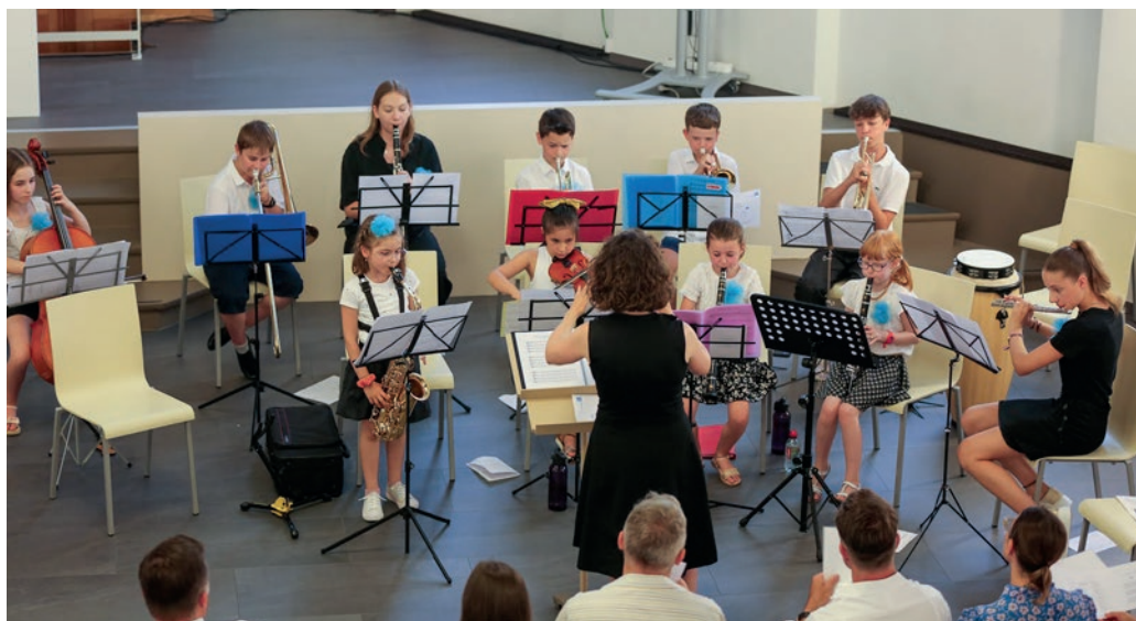
Veillée du samedi : l'orchestre des enfants