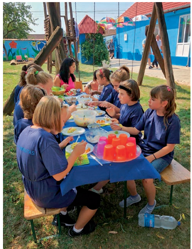
Des enfants joyeux du foyer pour enfants et de la crèche en Roumanie

À présent, dans le cadre de l'assemblée des apôtres de district, une action a été menée pour faire plaisir aux enfants. Pour ce faire, les salles polyvalentes de l'église ont été transformées en atelier de peinture. Des t-shirts bleu clair et des couleurs jaunes étaient à la disposition des épouses des présidents des Églises territoriales, qui se sont attelées avec beaucoup de plaisir à peindre des visages heureux sur les t-shirts, qui susciteront des visages heureux en Roumanie.