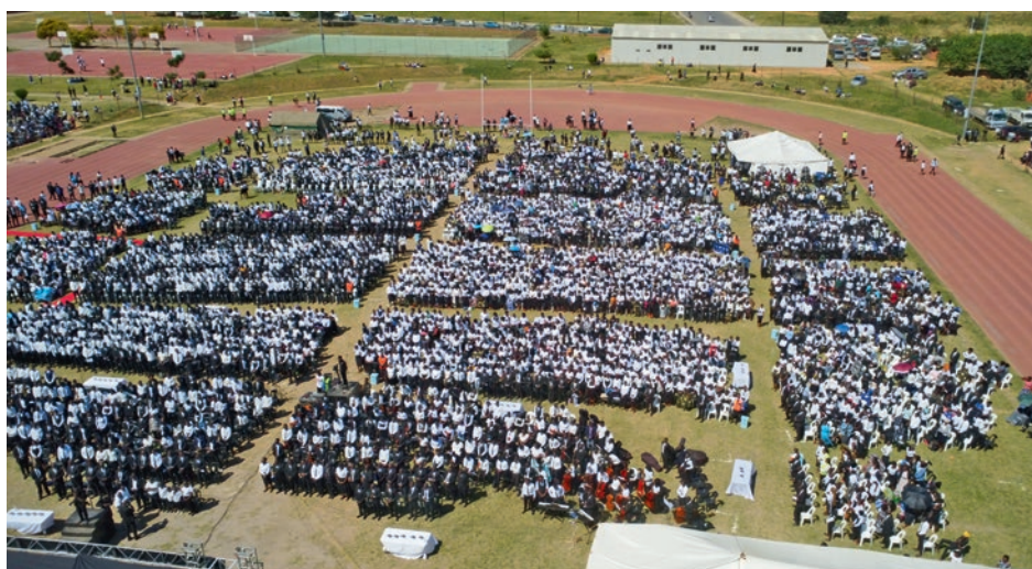
Service divin de jeunesse rassemblant 7000 jeunes à Lusaka (Zambie)

Un service divin rassemblant plus de 7000 participants, un concert avec près de 2000 participants et un rassemblement religieux qui occupe toute une ville : ces grands événements continuent d'avoir un impact – que ce soit à petite ou à grande échelle, ou comme une mélodie qui vous trotte dans la tête.