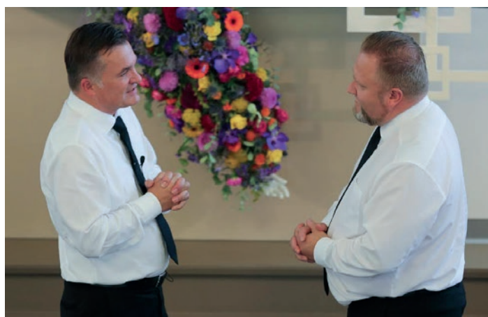
Mandatation d'un nouveau responsable pour le district de Lyon-Mulhouse