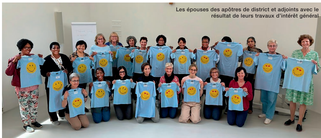
Les épouses des apôtres de district et adjoints avec le résultat de leurs travaux d'intérêt général

Des smileys jaunes sur des t-shirts bleus. Quel peut bien être le rapport avec un foyer pour enfants et une crèche en Roumanie, et avec 22 femmes du monde entier ?