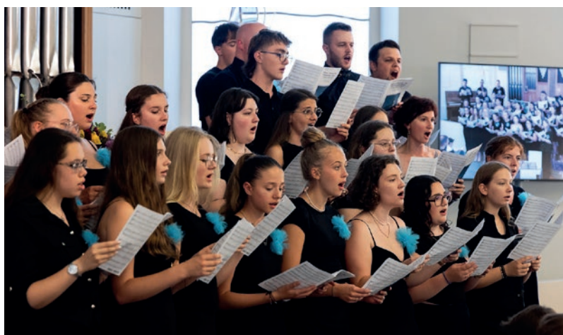
Veillée musicale : le chœur des jeunes