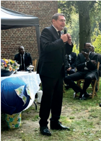
L'apôtre s'adresse aux enfants pendant le service divin L'orchestre des enfants pendant le service divin