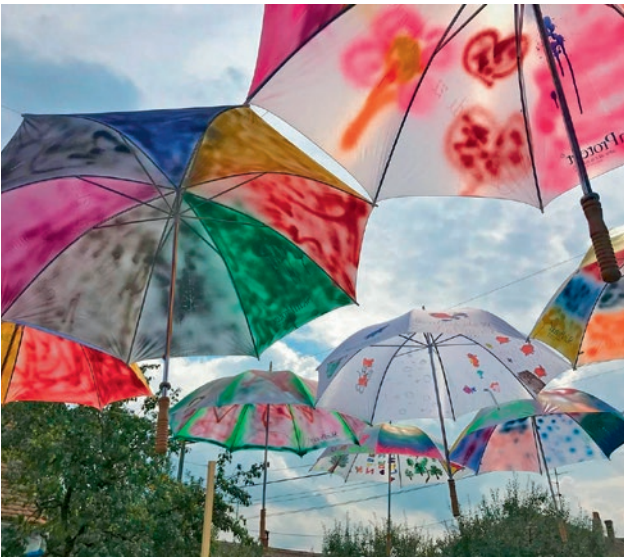
Festivités à l'occasion de la reprise du foyer pour enfants « Casa Pinochio »

ration avec « Kiru Kinderhilfe » Roumanie. Après l'école, 25 à 30 enfants issus de familles socialement défavorisées y étaient accueillis au début, contre une quarantaine aujourd'hui. Après un repas chaud, il est temps de faire les devoirs, souvent fastidieux, ou de jouer. Les animateurs veulent également transmettre des valeurs aux enfants et les préparer à une bonne vie dans la société. Ils ont par exemple levé les inhibitions des enfants face aux rencontres avec des personnes handicapées en invitant des personnes en fauteuil roulant à la garderie. Ceux-ci ont raconté aux enfants l'histoire de leur vie et leur ont appris à se déplacer en fauteuil roulant.