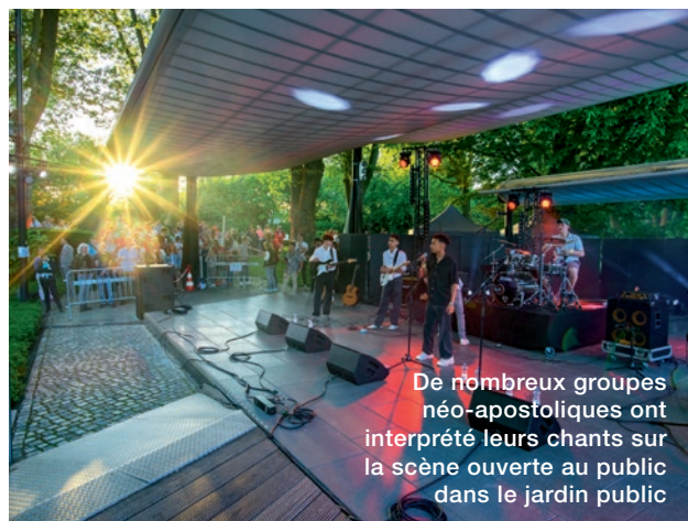
De nombreux groupes néo-apostoliques ont interprété leurs chants sur la scène ouverte au public dans le jardin public

Le « Kirchentag » s'est ainsi terminé et les participants ont été exhortés – « Allez ! » – à transmettre la joie et à la communiquer à autrui. À petite échelle, cela s'est traduit par exemple par un autocollant sur la place du marché, près de la scène sur laquelle différents groupes, chœurs et orchestres ont impressionné de nombreux visiteurs, même fortuits, au cours du week-end : « Sympa ici, mais avez-vous déjà assisté à un service divin de l'Église néo-apostolique ? »