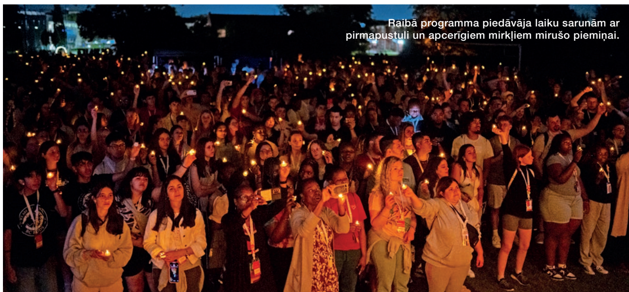
Raibā programma piedāvāja laiku sarunām ar pirmapustuli un apcerīgiem mirkļiem mirušo piemiņai.