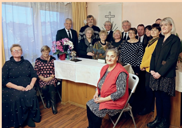
Varėnos NAB bendruomenė