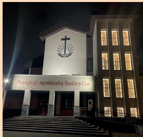
Klaipėdos bažnyčios bokšto vitražai