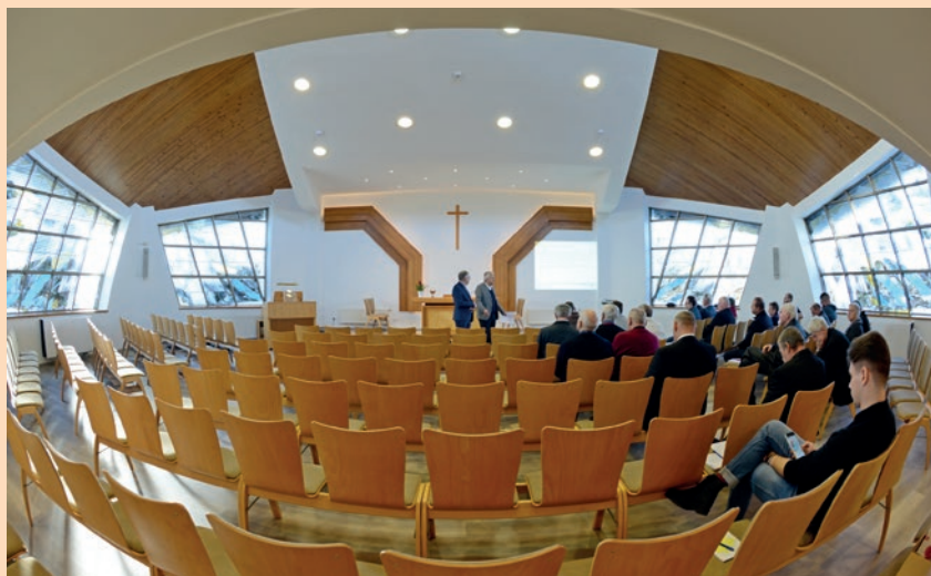
Kauno bažnyčia po renovacijos