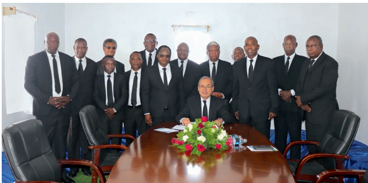
Përveç Apostullit të Distriktit Kububa Soko, ishin të pranishëm edhe disa ndihmës të apostujve afrikanë të distriktit si dhe apostuj të tjerë