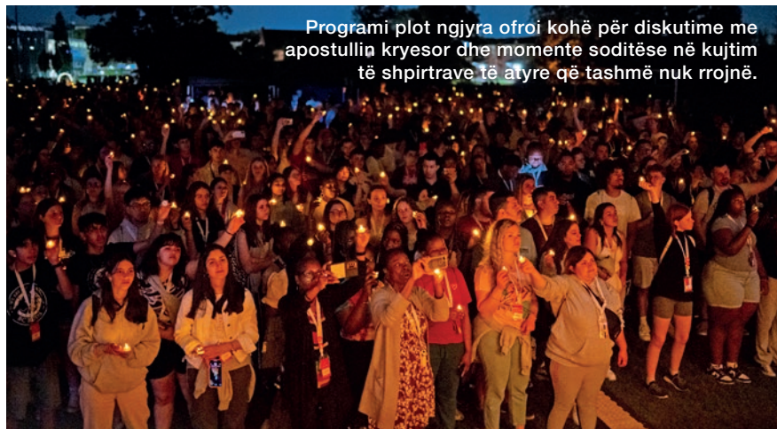
Programi plot ngjyra ofroi kohë për diskutime me apostullin kryesor dhe momente soditëse në kujtim të shpirtave të atyre që tashmë nuk rrojnë.