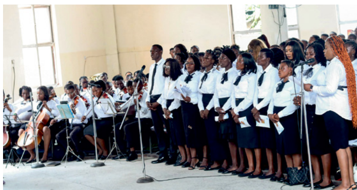
Accompagnement musical pendant le service divin