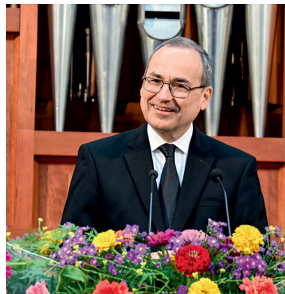
Visite de l'apôtre-patriarche à Buenos Aires (Argentine)

Nous avons tous besoin de la grâce. C'est pourquoi nous prions : 'S'il te plaît, Dieu, aie pitié de nous tous. Aie pitié de moi et aie pitié de mon prochain'.