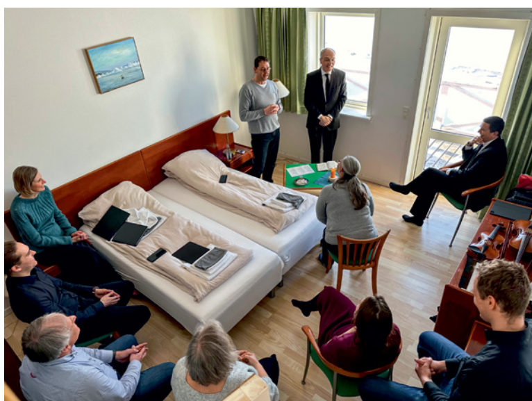
Service divin avec une sœur à Iluisaat (Groenland)

À propos d'unité dans la différence. Il est souvent plus facile d'accepter la diversité à l'étranger qu'à la maison. Comment peut-on éviter cela ?