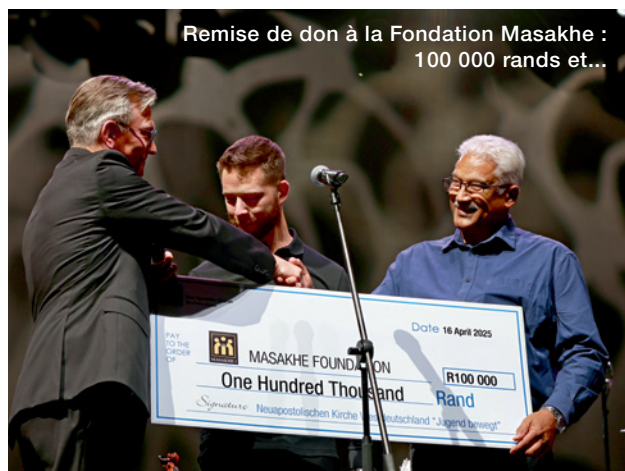
Remise de don à la Fondation Masakhe : 100 000 rands et...

... quatre cartons remplis de matériel scolaire