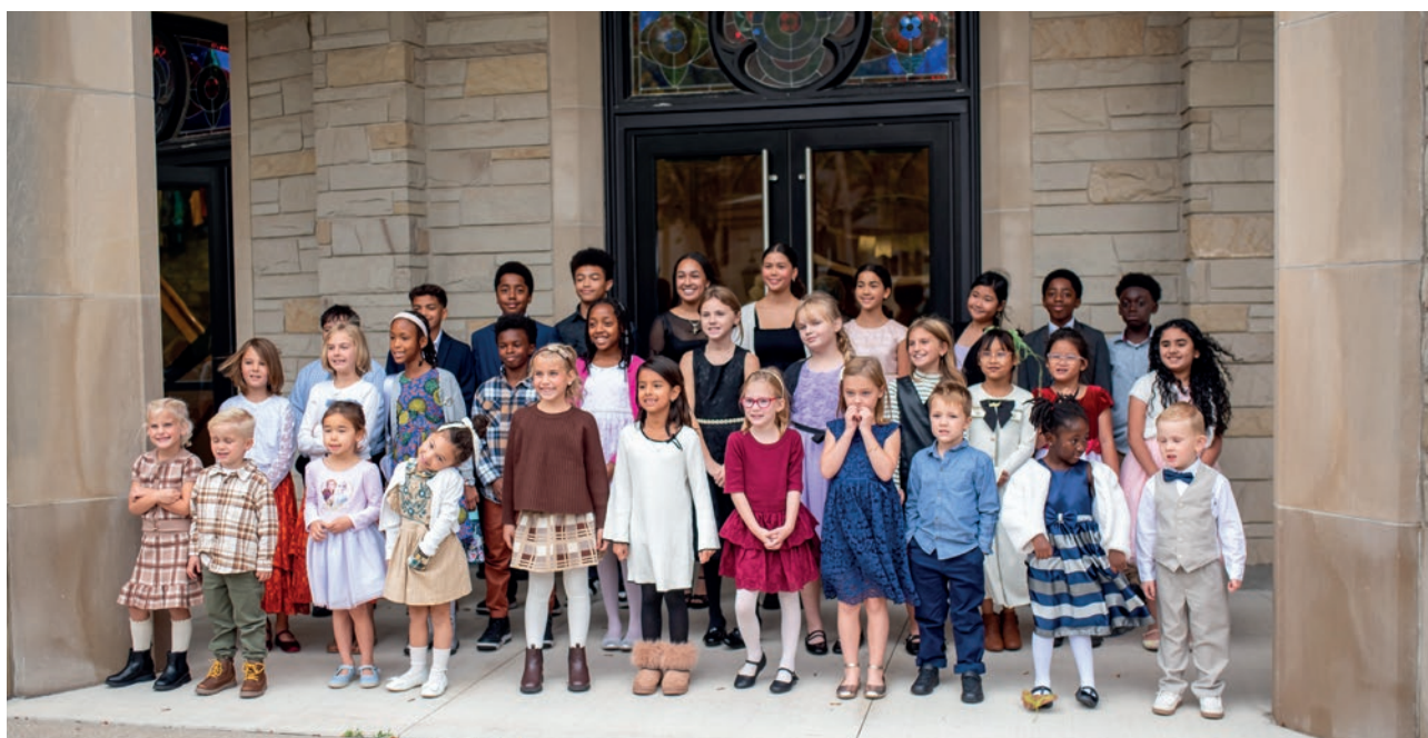
Fëmijët përshëndesin apostullin kryesor me një këngë pas mbërritjes së tij.

Jezusi bëri thirrje për një mënyrë krejtësisht të re të të menduarit: Njerëzit duhet të ndryshojnë qëndrimin e zemrave të tyre - gjithçka duhej të ishte e re.