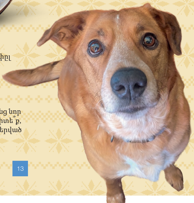
Աղբյուր՝ ԱննաՎոր՝ Մեկեր՝ երեխաներու, Իրատարակութուն 06/2025, Լուսանկարները՝ մասնավոր՝ stock.adobe:Paolo, MaskaRad, annapustymnikova, Margrit Hirsch

Անգլերեն թխկու տերերը կոչվում է մեյփրլ լիիֆ: Մեր ընտանեկան շնիկի անունը Մեյփրլ է, քանի որ նա, երբ յոթ տարի առաջ մեզ մոտ եկավ, իր գույներով համապատասխանում էր տերևներին, որոնք հենց նոր էին ընկել ծառերից: Գիտե՞ք, որ թխկու տերերը պատկերված է Կանադայի դրոշի վրա: