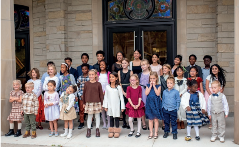
Երեխաներ ժամանման պահին ողջունում են գլխավոր առաքյալին