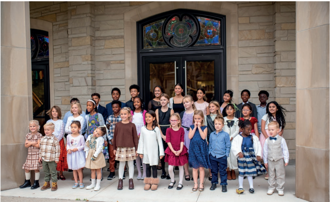
Bērni sveic ar dziesmu pirmapustuli pēc viņa ierašanās

Jēzus paskaidroja, ka ar noteikumu un tradīciju ievērošanu nepietiek. Svarīga ir sirds attieksme — mīlestība pret Dievu un tuvāko ir būtiska. Problēma: šai sirds attieksmei nav ietekmes uz ārējo pasauli. Ikviens var redzēt, ka tiem, kas