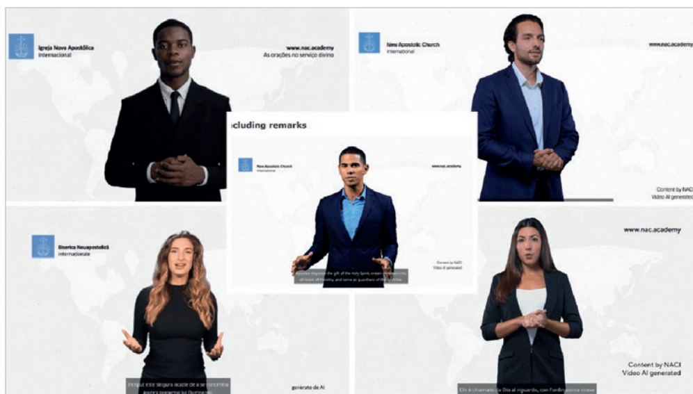
Nac.academy kursi ir pieejami dažādās valodās

dzīvē. Ticība vai neticība, piedošana vai nesamierināmība, mīlestība vai naidis veido cilvēkus ne tikai šajā pasaulē, bet arī nākotnē. Šis stāvoklis ir aplūkots arī Jēzus līdzībā par bagāto vīru un nabaga Lācaru (sal. Lk. 16, 19-31), kad tā runā par drošības vietu un mocību vietu. Mīrušais var uzzināt par savu stāvokli. Tie, kas cieš mokas, cer uz palīdzību.