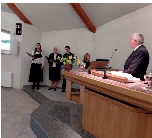
Attēls: Latvijas Jaunapustuliskā baznīca