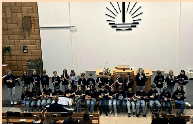
Koncertas Motinos dienai Klaipėdos NAB bendruomenėje